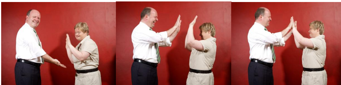
'Q-FIT voor een duurzame match tussen vraag en aanbod'

Graag zou ik advies ontvangen zodat ik een onafhankelijk en deskundig rapport heb van de zorg-, onderwijs-, en therapiebehoefte van onze zoon, waarmee ik verder de bres op kan gaan in mijn zoektocht naar maatwerk".